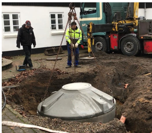
En BioKube beton 5PE bliver installeret

BioKubes betonanlæg er et minirenselanlæg, med integreret bundfældningstank, installeret i en cylinderformet betontank med kegleformet top. Renseanlægget er opdriftssikret og standardmodellen er kørefast til personbiltransport. Anlægget kan opgraderes til tung transport. Anlægget er testet og godkendt til renskravene O, OP, SO, SOP